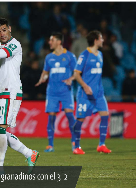
granadinos con el 3-2