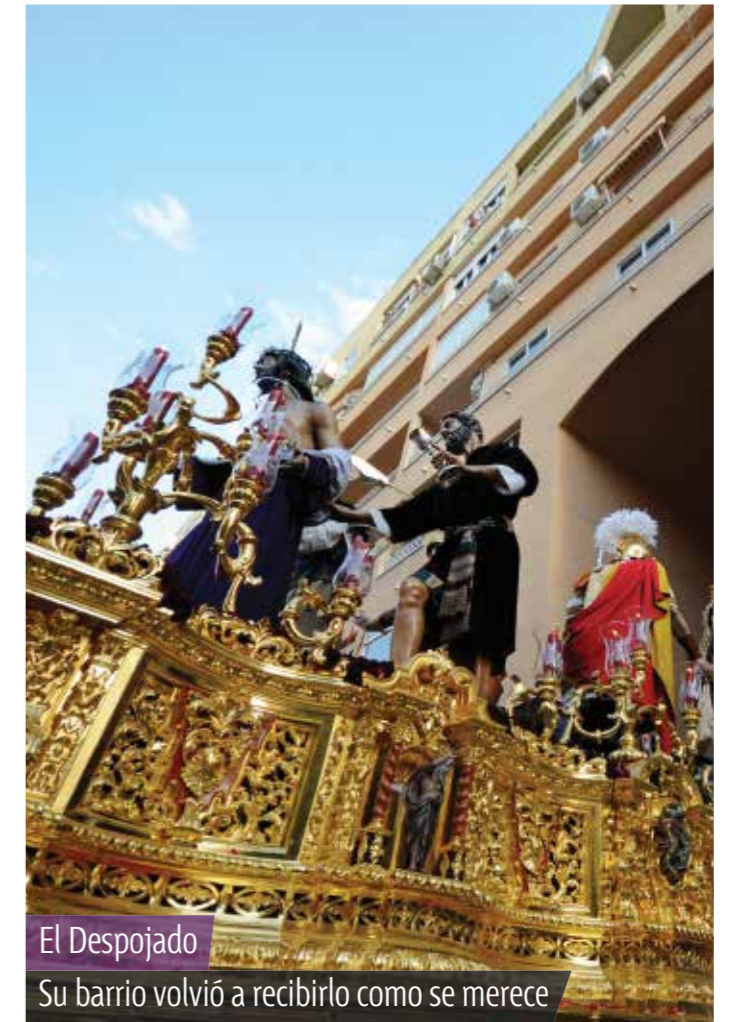
El Despojado Su barrio volvió a recibirlo como se merece