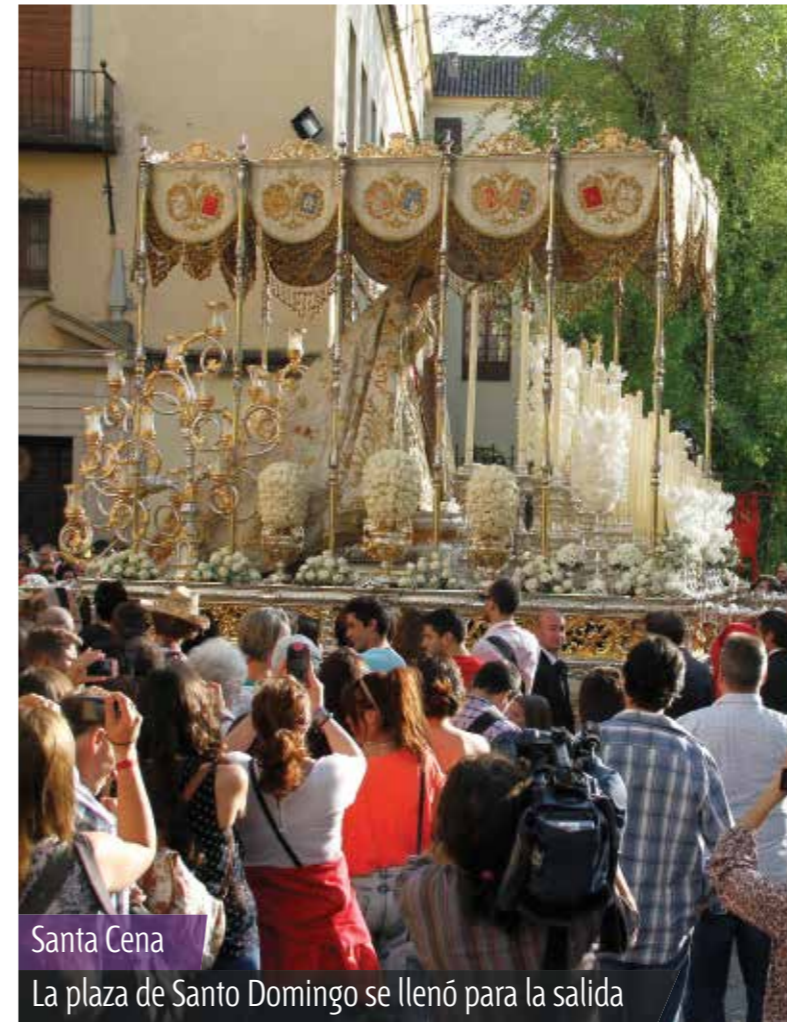
Santa Cena La plaza de Santo Domingo se llenó para la salida