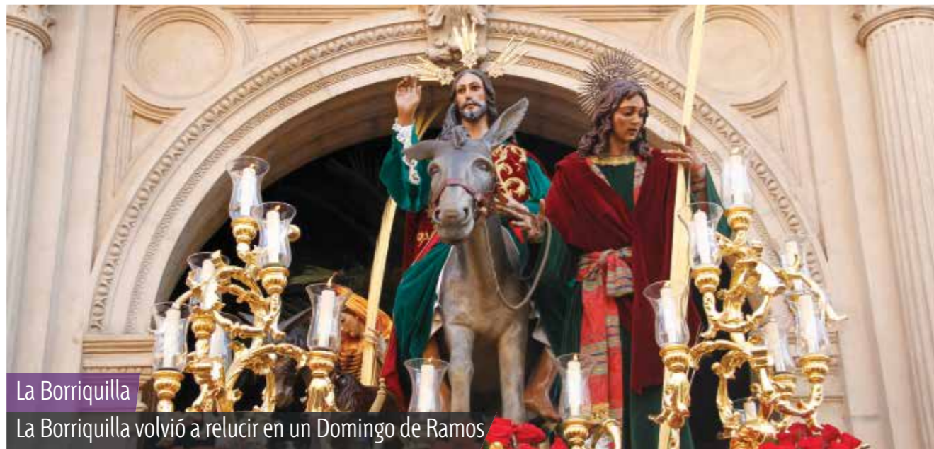
La Borriquilla La Borriquilla volvió a relucir en un Domingo de Ramos