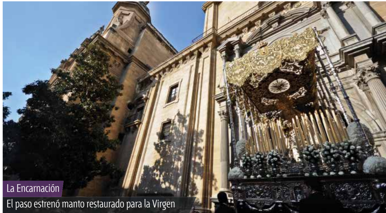
La Encarnación El paso estrenó manto restaurado para la Virgen