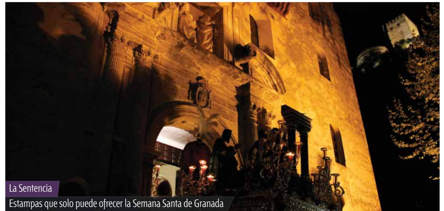
La Sentencia Estampas que solo puede ofrecer la Semana Santa de Granada

Tras el mal sabor que quedó en el Domingo de Ramos de hace un año, el sol hizo justicia en el de 2014 y las cinco hermandades brillaron con luz propia en una jornada de ensueño. Las calles, repletas de gente, pudieron presenciar un buen discurrir de las hermandades, con el acertado estreno de la calle Alhóndiga como nota destacada.