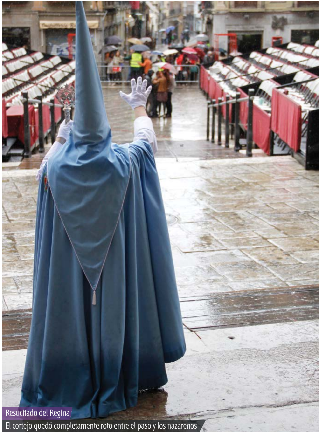
Resucitado del Regina

El cortejo quedó completamente roto entre el paso y los nazarenos