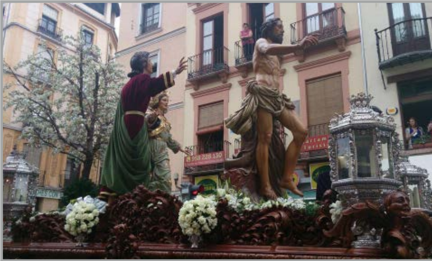
MrBop10 - @MrBop10 Resucitado #SSantaGR14