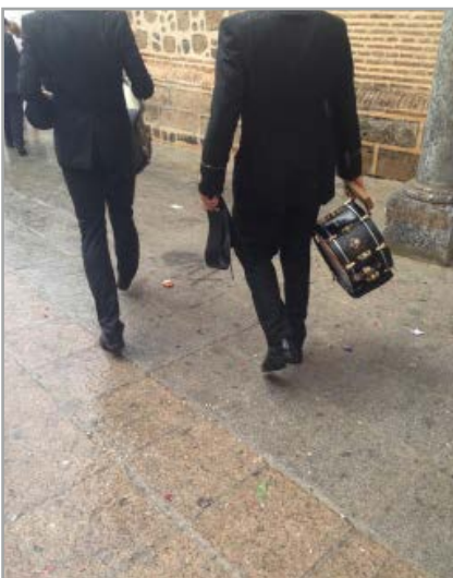
Banda de Armilla - @BandadeArmilla Y la lluvia volvió a hacer acto de presencia..aunque no nos impidió pasear a La Reina de los Cielos por Almuñecar