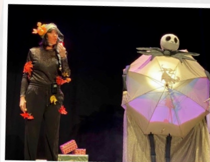
El Señor Sapo.